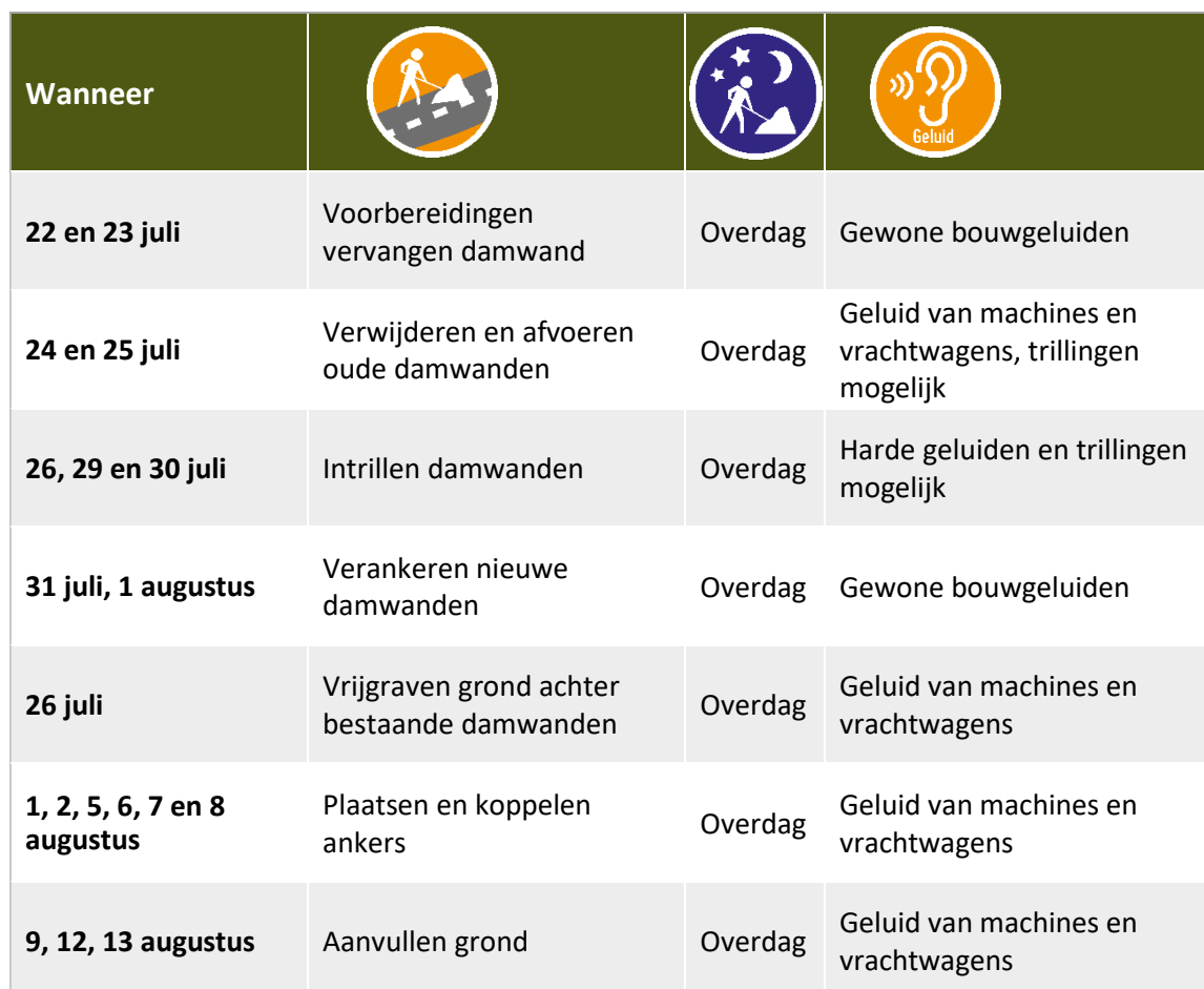
Tabel belangrijkste werkzaamheden en mogelijke overlast

De data zijn onder voorbehoud. Werkzaamheden met de vermelding 'Overdag' en overige werkzaamheden voeren we uit op maandag tot en met vrijdag tussen 07.00 uur en 16.00 uur.