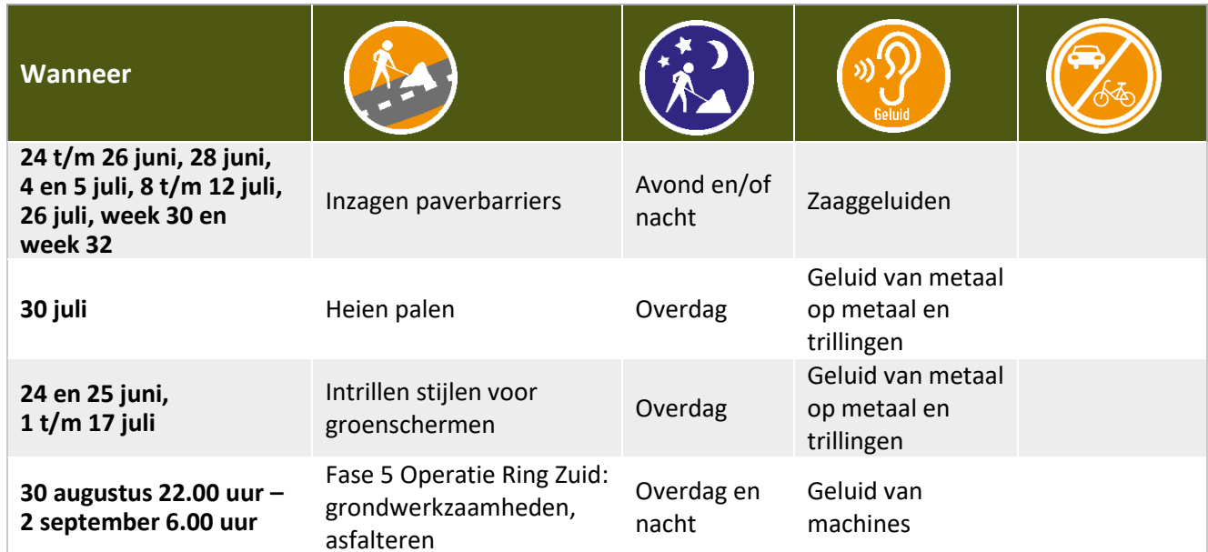
Tabel werkzaamheden en hinder omgeving Julianaplein tot 2 september 2024

De data zijn onder voorbehoud. Werkzaamheden met de vermelding 'Overdag' en overige werkzaamheden voeren we uit op maandag tot en met zaterdag tussen 07.00 uur en 19.00 uur.